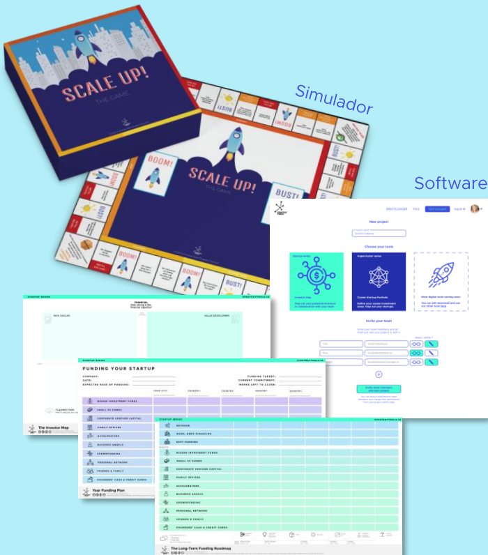
Lienzos de Strategy Tools